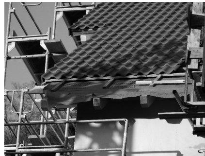
Gut gedämmt, ist halb gelüftet

Wer sich selbst oder seine Mieterinnen und Mieter zukünftig vor extremer Hitze schützen möchte, kann unter 07141 688 930 einen Termin zur kostenlosen Energieberatung vereinbaren. Dort beantworten Expert:innen der LEA persönliche Fragen zum baulichen Wärme- und Hitzeschutz.