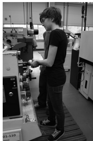
Foto: Jugendliche erhalten beim Firmensommer Einblicke in die unterschiedlichen Branchen, wie hier zum Beispiel in technische Berufe.

Wer über die Homepage hinausgehende Informationen benötigt, kann sich an das Firmensommer-Team wenden – per E-Mail an: team@firmensommer.de und unter der Telefonnummer 07141 144 2028.