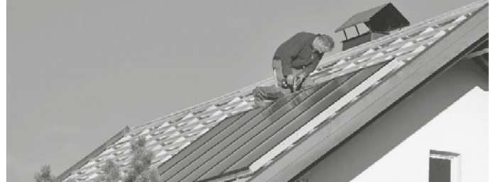
Liegt die Installation 20 Jahre zurück, endet die EEG-Förderung.

Wer Fragen zur Umrüstung oder rund um das Thema Solarenergie hat, kann die kostenfreie Energieberatung der LEA in Anspruch nehmen und unter 07141 68893-0 einen Termin vereinbaren.