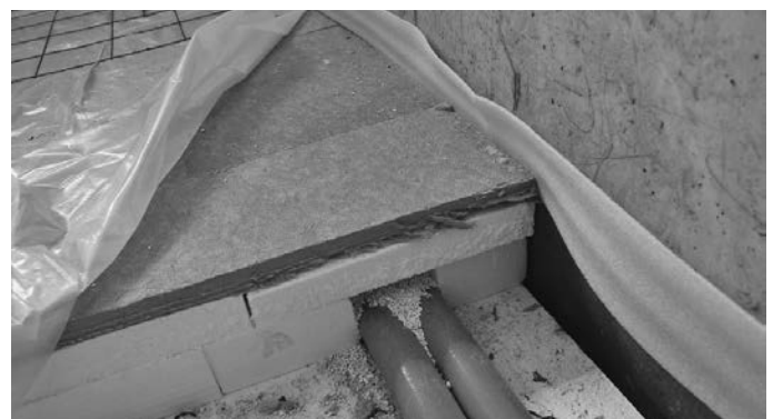
Auch über undichte Rohrführungen kann Hitze ins Gebäude eindringen

Um Fragen rund um die Wärme- und Hitzedämmung, sowie finanzielle Fördermöglichkeiten zu besprechen, bietet die LEA eine telefonische Beratung an. Unter 07141 68893-0 können Sie jederzeit einen Termin für eine kostenlose Erstberatung vereinbaren.