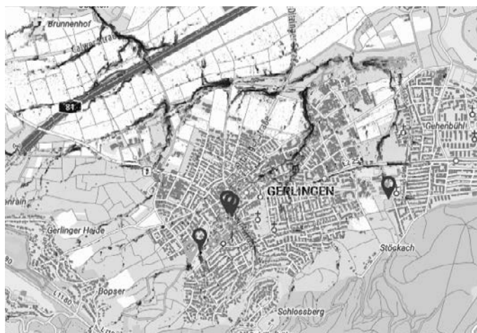
Ausschnitt der Starkregengefahrenkarte für Gerlingen

Die Starkregengefahrenkarten finden alle Interessierten im Internet unter www.starkregengefahr.de/baden-wuerttemberg/glems