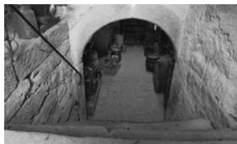
Vom Hof aus geht's in den Vorratskeller