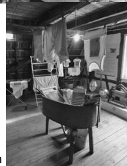
Wäsche auf dem Dachboden