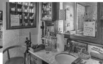
Blick in die Frisörstube