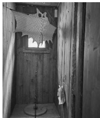
Fledermausdrachen im Plumpsklo