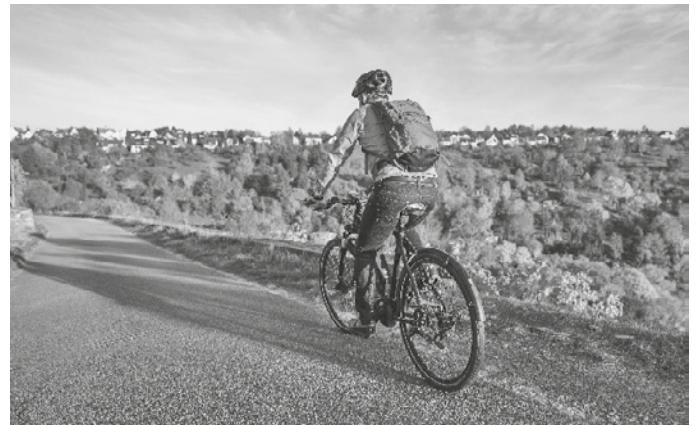
Auf dem Dienstrad wird der Weg zur Arbeit ein Vergnügen

Mit dem Dienstrad-Leasing wird Mitarbeitermotivation und -gesundheit gefördert und gleichzeitig der CO 2 -Ausstoß reduziert. Dazu kommt die kostenneutrale und einfache Umsetzung des Rahmenvertrags. Deshalb sind Arbeitgeber immer häufiger bereit, ein Dienstrad zur Verfügung zu stellen. Sollte der eigene Arbeitgeber noch kein Fahrrad-Leasing anbieten, ist Initiative durch Arbeitnehmende gefragt – Arbeitgeber überzeugen und mit dem eigenen Dienstrad beim Stadtradeln antreten.